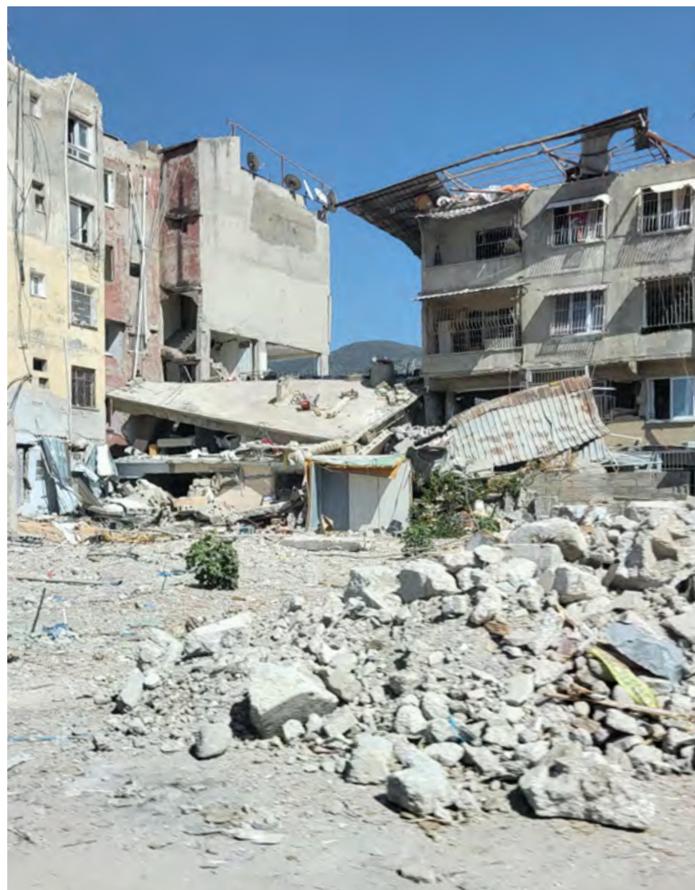
Antakya nach dem Erdbeben